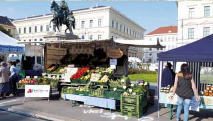
Bauernmarkt Rattenberg auf der Bauernmarktmeile München